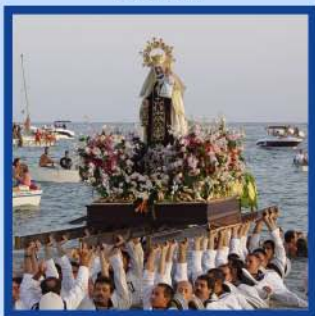
Feria del Rincón de la Victoria